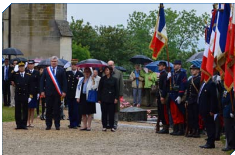
L'arrivée des autorités sur l'esplanade et sous la pluie. Une météo exécrable qui n'empêcha pas le recueillement et se poursuivit jusqu'au lâcher de ballons tricolores en fin de cérémonie.